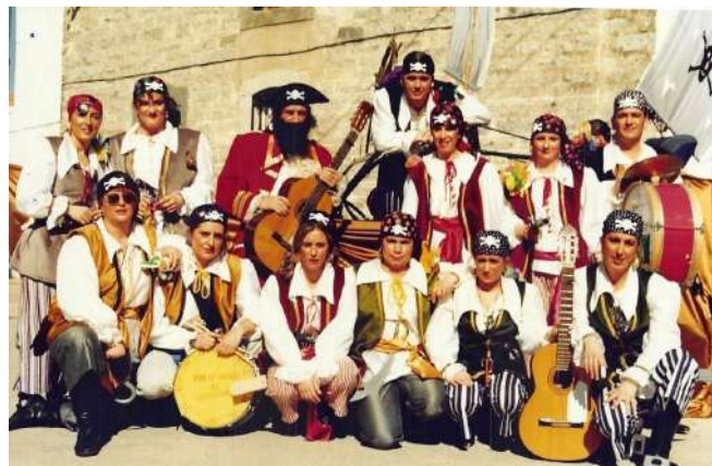
Chirigota: Pirate-ando en carnaval 1994