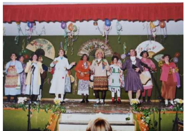
Chirigota: Las Marujas 1997