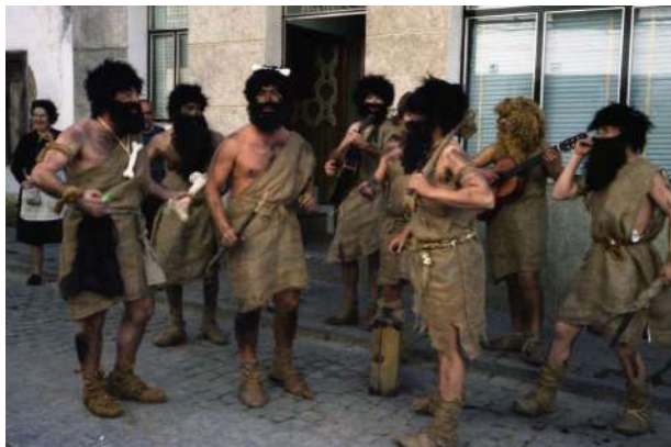
Chirigota: Los Mojinos de Cromañón 1988