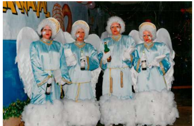
Cuarteto: Los Angelitos 1992