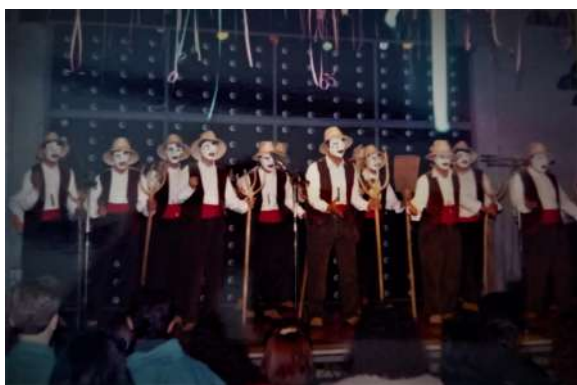
Comparsa: Los Campesinos 1993