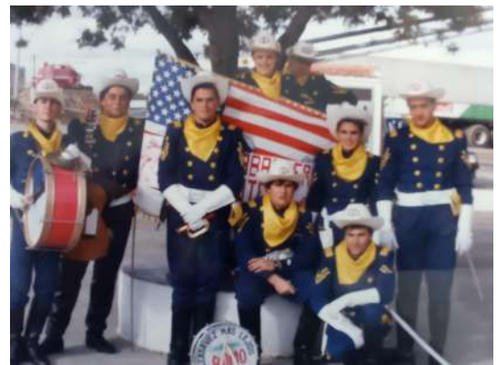
Chirigota: El séptimo de caballería 1991