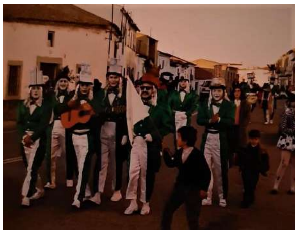
Chirigota: Los Ruinas de Alcaracejos 1991