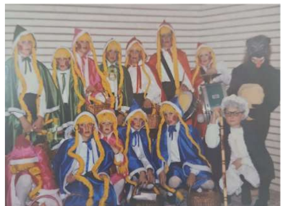
Chirigota: Los Caperucitos rojos 1993