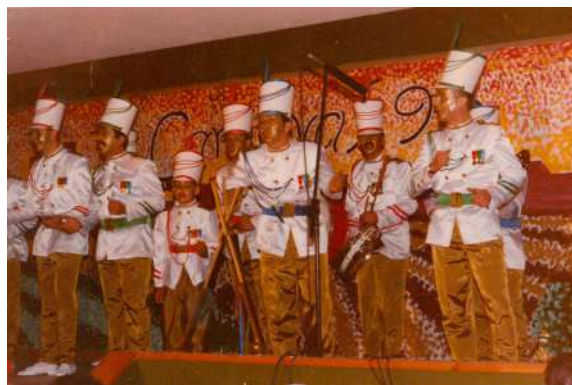
Comparsa: Los Soldaditos 1993