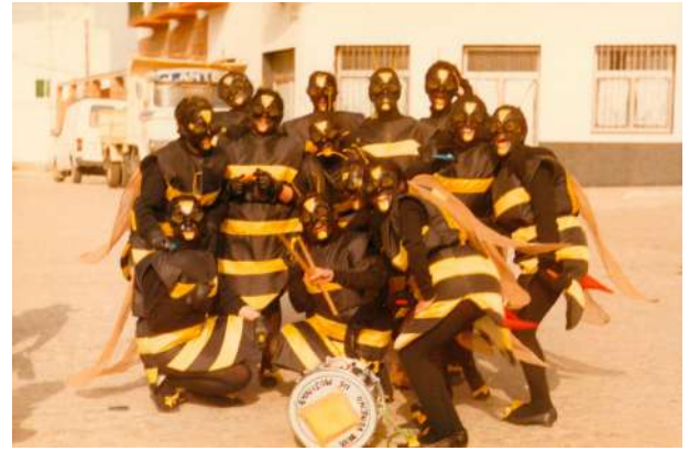
Chirigota: Las Avispas 1990