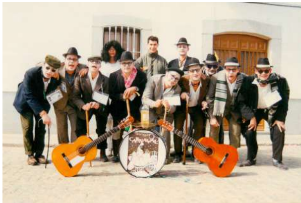
Chirigota: Los Abuelos 1995