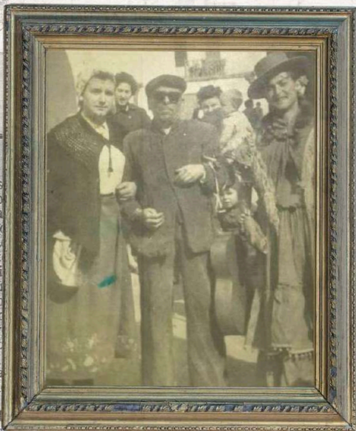
EL CÍRCULO DE LA UNIÓN TIENEN TUVIERON LA FERIA DE LA VILLA MUNICIPAL.