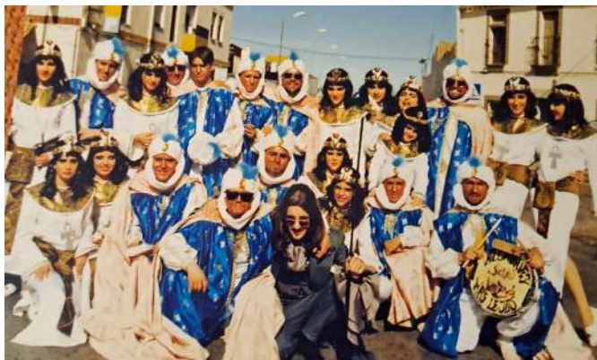
Comparsas: Los Moros y las Egipcias 1994