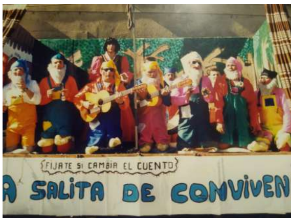
Chirigota: Los Enanitos 1994