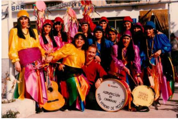
Chirigota: Adivinan las que vienen 1993