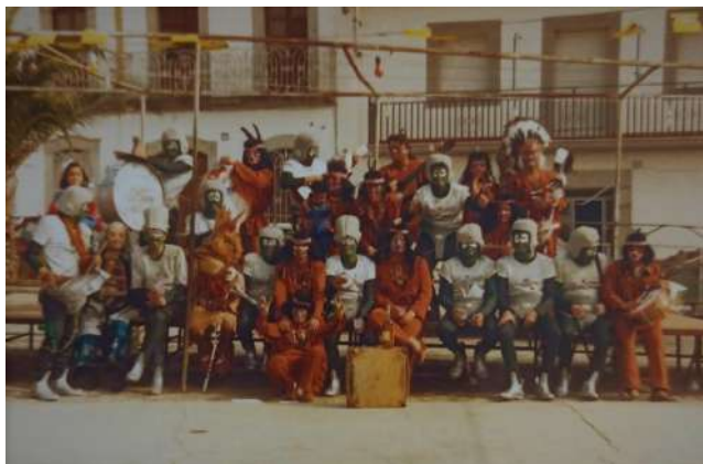
Chirigota: Los Mojinicos atómicos y los Indios 1990