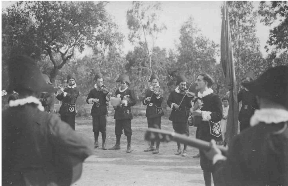
(Imagen 3) La tuna del Soldado ataviados de carnaval y tocando sus instrumentos probablemente en el mismo Soldado, entre los eucaliptos de las casas de los jefes.

Este tercer artículo habla de la estudiantina o tuna del Soldado (Imagen 3), que actuó según afirma el extracto en Alcaracejos. No se ha podido confirmar el año en que se publica el periódico en el que se introduce esta noticia pero estaríamos hablando de alrededor de 1925.