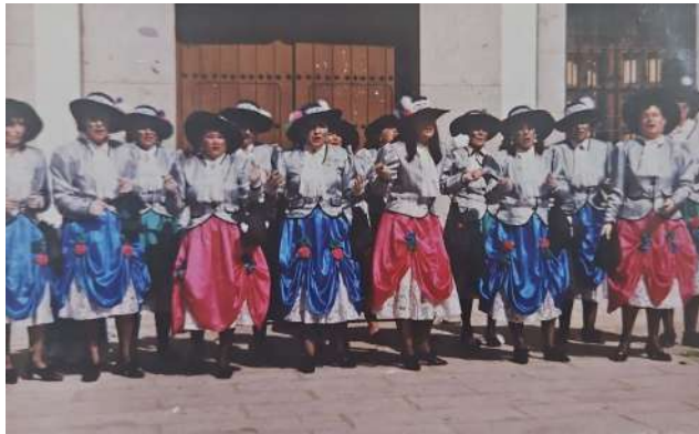
Chirigota: Las Chicas del can-can 1993