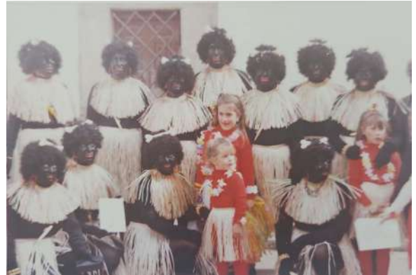
Chirigota: Las Negritas cachondonas 1992