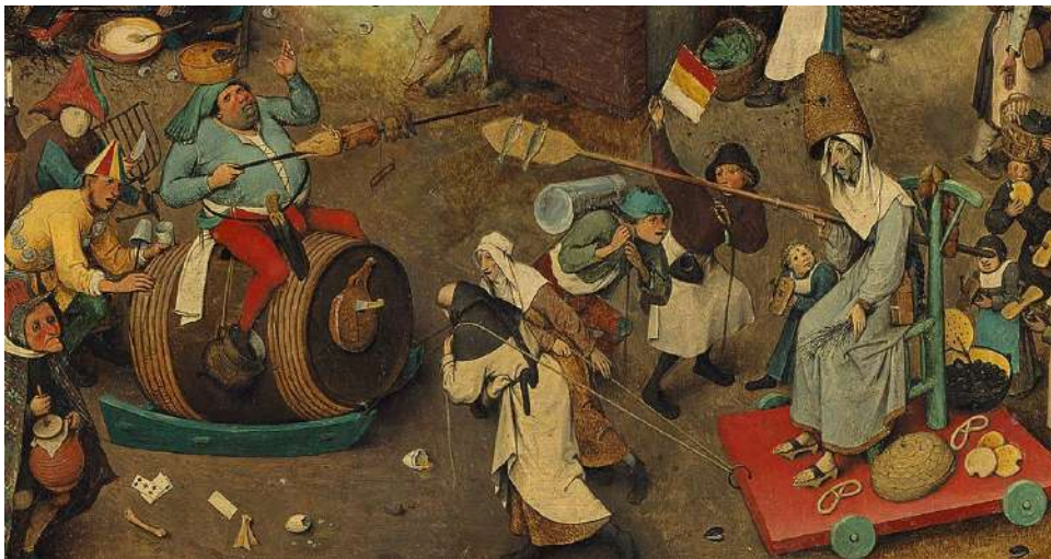
(Imagen 1) Pieter Brueghel el Viejo, El combate entre Don Carnal y Doña Cuaresma , 1559. Museo de Historia del Arte de Viena, Austria.

Don Carnal y Doña Cuaresma personifican la confrontación de dos periodos en los que las actividades, fiestas y comportamientos sociales eran radicalmente diferentes. Siguiendo un orden cronológico, primero tendría lugar el Carnaval, que supone una etapa de permisividad y libertad moral y ética en la que se rompen las normas y el orden establecidos e inmediatamente después se inicia la Cuaresma, un periodo de recogimiento y ayuno para el cristianismo que constituye una vuelta a los valores tradicionales. Esta confrontación ha sido representada en el arte en diversas ocasiones, como podemos ver en el caso de la pintura con la obra de Pieter Brueghel el Viejo (Imagen 1), donde se muestran a la derecha los valores religiosos cristianos y a la izquierda las costumbres populares y la moral relajada propia de las fechas carnalescas.