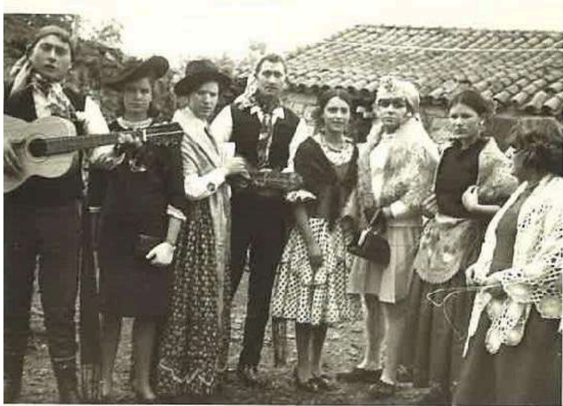
(Imagen 6) Día de campo celebrando el carnaval.