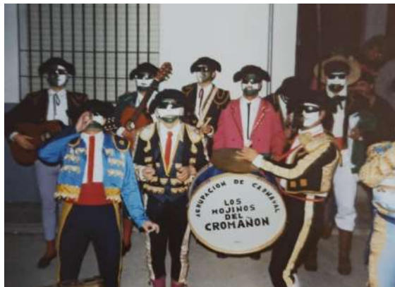
Chirigota: Los Toreros 1989